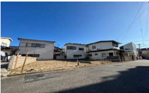
鍛冶ヶ谷2丁目II 1号棟