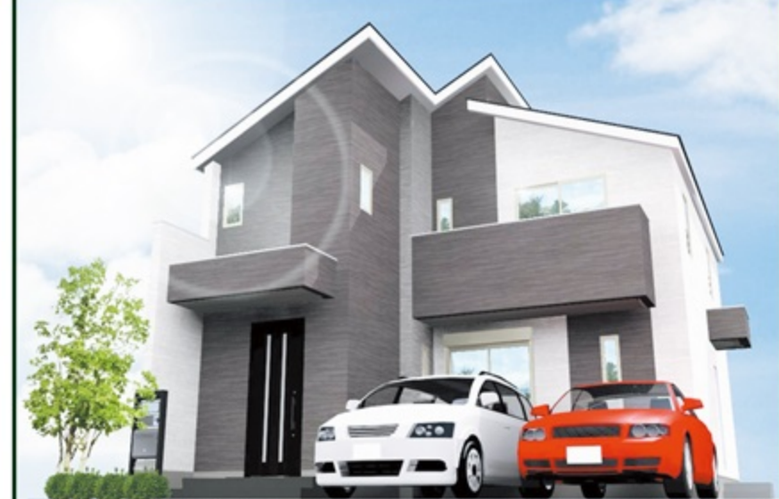
<完成予想図> 実際と多少異なる場合があります。図面と現況が異なる場合は現況を優先します。